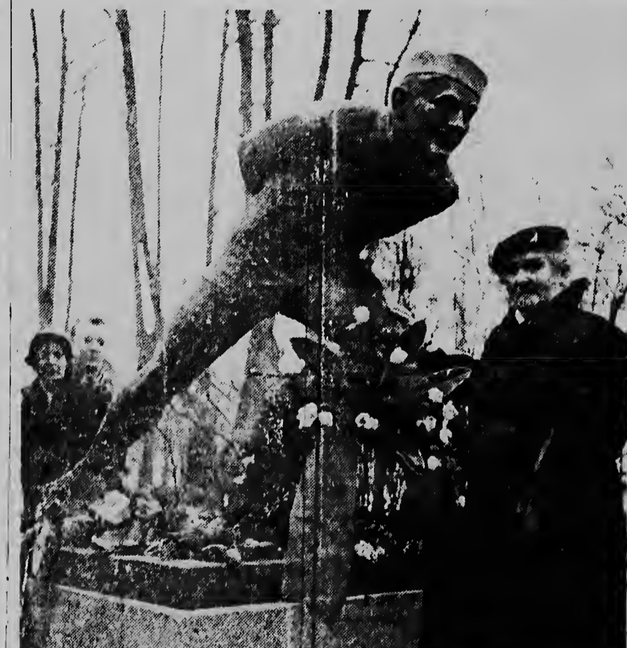
Na entrada di Frogner Stadion na Oslo, nan a inaugura un estadia di e gran corredor di schaats Noruego Oscar Mathisen...